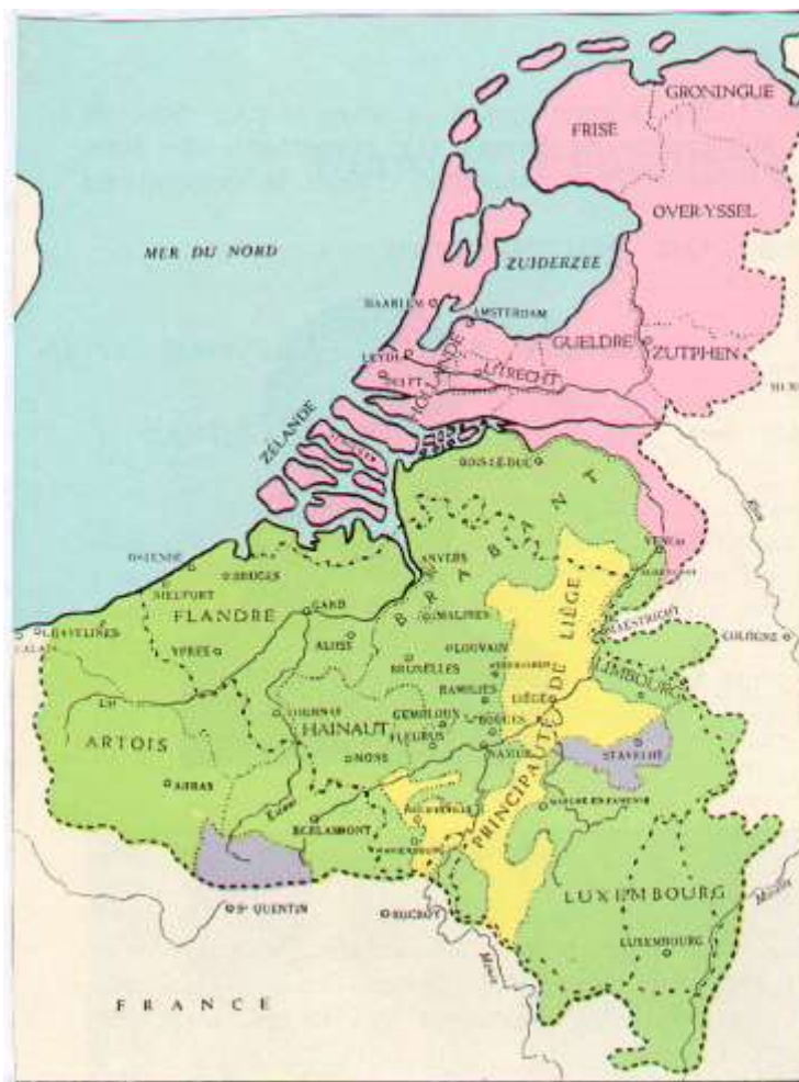
Nederlandene i den spanske periode 1558-1713