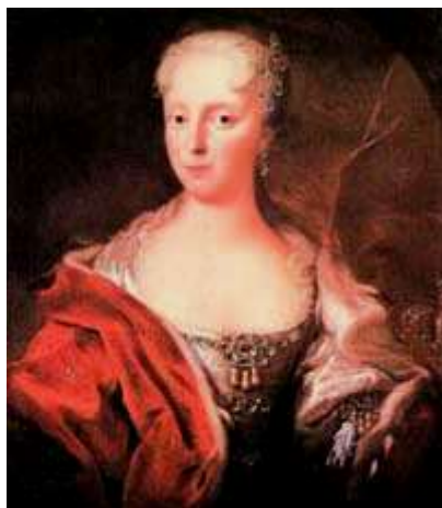
Dronning Anna Sofie Reventlow, Frederik IV's hustru fra 1721