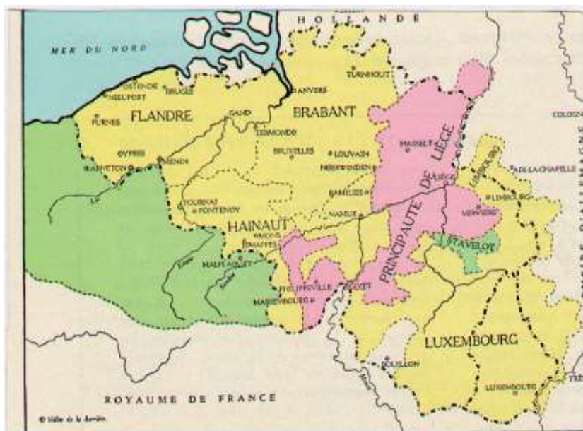
De østrigske Nederlande (med gult), fra 1714 til 1794, med det meste af det nuværende Belgien