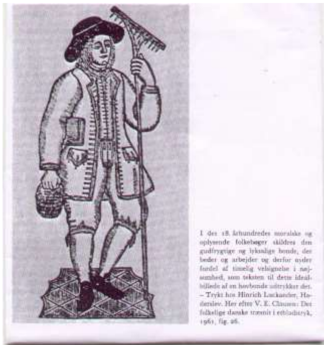
En typisk bonde fra ca. 1750