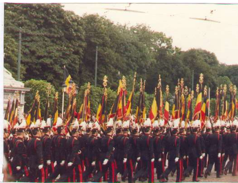
Fra Belgiens 150 års jubilæumsdag i 1980