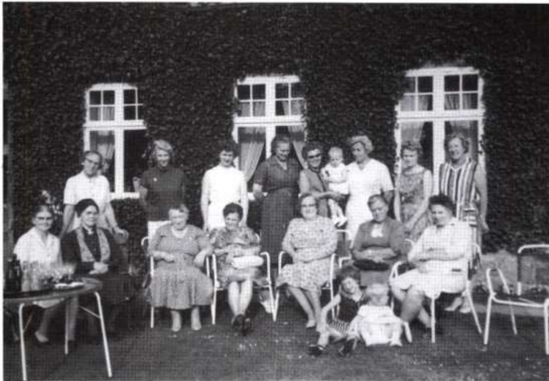
Syklub på Luenhøj.